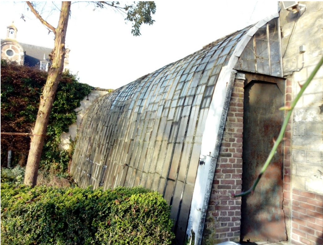
Serre Vroenhof Houthem (± 1850)

keurig opgetekend. Er is speurwerk verricht naar vergelijkbare oude boogserres in Nederland en België. veel voorbeelden zijn er niet meer, nog slechts een handvol. Bij kasteeltje Gurtsenich in Houthem staat nog een mooi exemplaar.