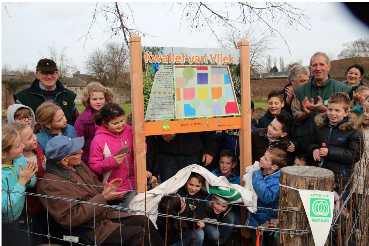
2014 onthulling bord bij de ingang.

We ontmoeten u graag. Als we aan het werk zijn is het hek open. Ook kunt u een afspraak maken (info op de website).